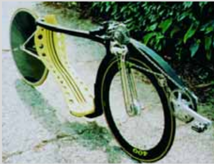
De Hachi van Rob English.

Van slordige zelfbouw hippy-fietsen, naar gelikt hi-tech design en dito materialen: dat is het beeld dat uit de vergelijking van de oude Duitse en de recente Engelse zelfbouw-gids naar voren komt. In Nederland is het ongetwijfeld niet anders gegaan. Het Duitse gidsje was voor € 4,00 enkele jaren geleden nog verkrijgbaar bij Liegerad-Datei Verlag ( www.liegerad.de ). De Engelse handleiding is voor £ 7,50 (inclusief porto) te krijgen via de BHPC (zie: www.bhpc.org.uk - daar is ook een inhoudsopgave te vinden). De eigenwijze Britten doen helaas niet aan euro’s of credit cards.