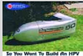
Rob English, So you want to build an HPV . British Human Power Club, 3e druk 2004 (1e 1985), 50 blz.

De laatste, derde uitgave van So you want is nog niet zolang geleden verschenen, in 2004, na eerdere edities in 1985 en 1996. Ik beschik helaas niet over de twee eerdere uitgaven om iets over de geschiedenis van het zelfbouwen te kunnen zeggen. Maar ik kan het boekje wel vergelijken met een Duitse zelfbouw-gids uit de jaren tachtig.