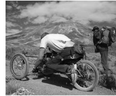
Jimmy Goddard beklom in 2006 de Kilimanjaro op een all terrain handcycle van One-Off Titanium.

Het Britse fietsblad Velo Vision publiceerde tot voor kort in elk nummer een koopgids. Hierin wordt een informatief overzicht gegeven van de belangrijkste producten binnen een bepaalde sector van de fietsbranche, bijvoorbeeld transportfietsen of versnellingsnaven. Al tweemaal, in 2003 en 2005, wijdde het blad een koopgids aan special needs cycling , fietsen met een handicap. Deze koopgidsen zijn als enige gratis te downloaden van de website www.velovision.co.uk . Aan de online-gids van