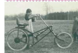
Het J-Rad , www.jarayfamily.net .