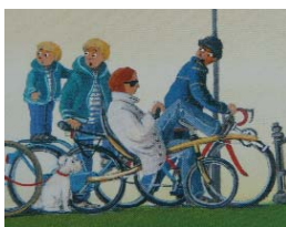
Details uit 'Fiets' van Charlotte Dematons.